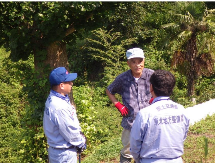
◀ 聞き取り調査状況

この地図は、国土地理院長の承認を得て、同院発行の電子地形図(タイル)を複製したものである。 【承認番号 平29東複、第33号】