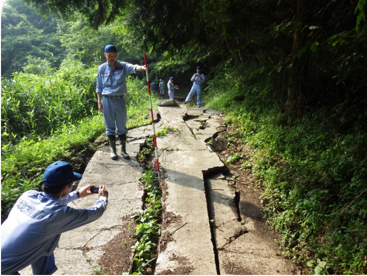
▲地滑り箇所への調査状況