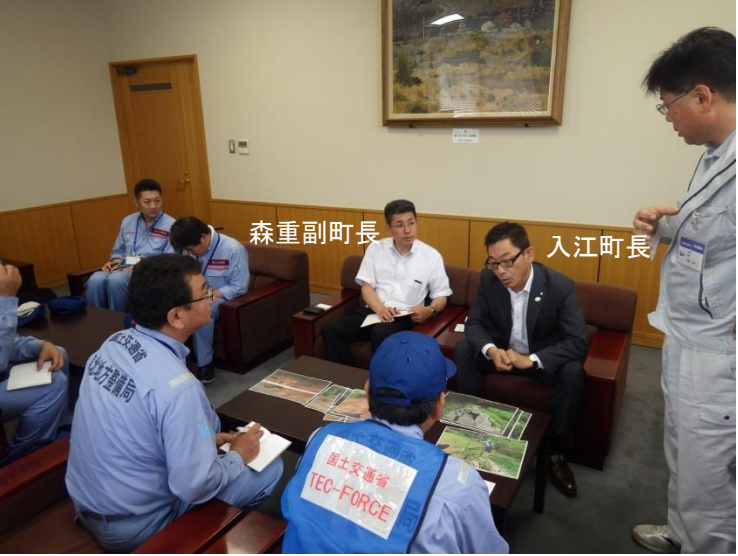
▲神石高原町と打合せ