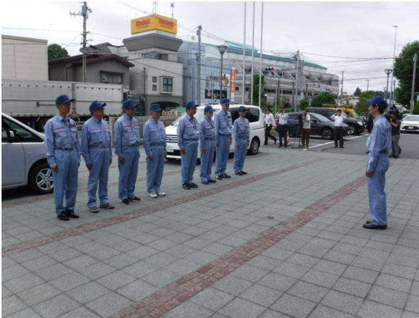
▲佐近事務所長から激励の言葉