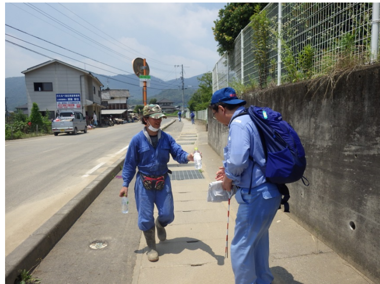
◀ 地域の方から水の差入れ