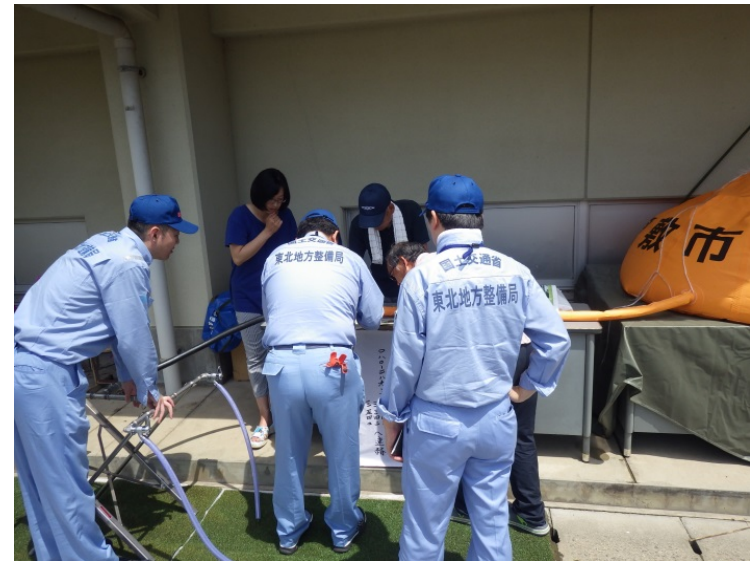
▲被災状況の聞き取り調査