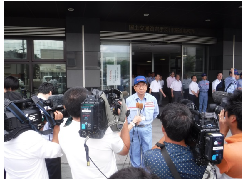
▲報道機関8社から取材