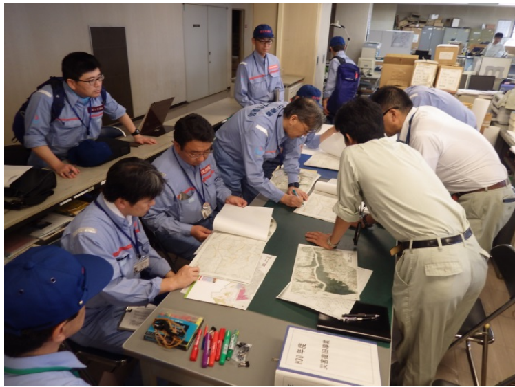
▲倉敷市土木課と打合せ