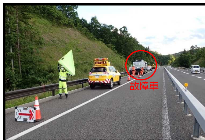
故障車とレッカー作業の状況