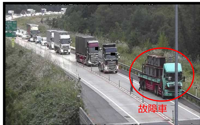
故障車と渋滞の状況