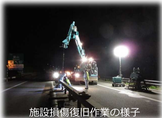
施設損傷復旧作業の様子