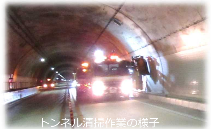
トンネル清掃作業の様子