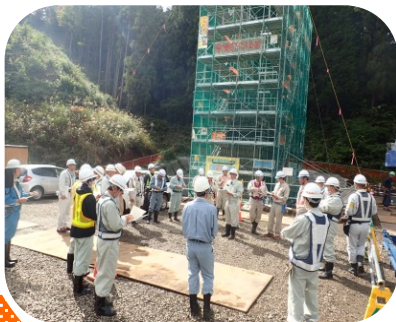
▲ 現場パトロールの様子 ▲

10月24日(水)、第1回伊達地区安全パトロールを実施しました。発注者と受注者合わせて50名が参加し、上保原こ線橋下部工工事・掛田橋下部工工事のパトロールを行いました。改善すべき点については速やかに対処し、工事事故ゼロを目指します。