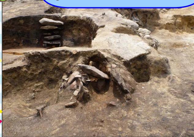
平安時代の住居跡のかまど