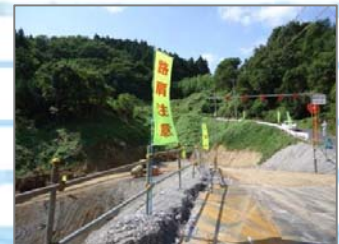
注意喚起の昇り旗