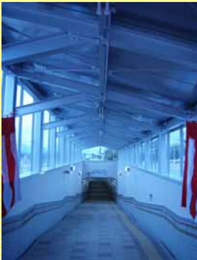
白を基調とした清潔な空間 階段ではなく傾斜の緩いスロープ

式典終了後、この地下道を通り通学することになった「大玉村立大山小学校」の生徒のみなさんに施設の使い方の説明しました。