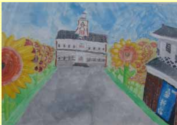
フラワーロード賞の作品 旧伊達郡役所、桑折宿のまわりにたくさん花咲いたひまわりの絵

大賞・特別賞の作品は桑折町商工会館の堀に展示され、今度は絵の中でひまわりが花咲いてました。