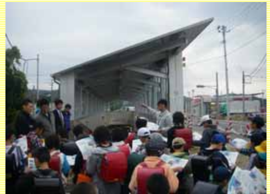
非常警報装置の使い方などを熱心に聞いていました。 大切に使うくださいね。