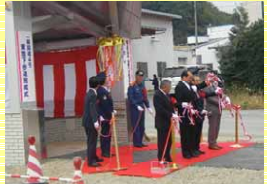
テープカット・くす玉開披