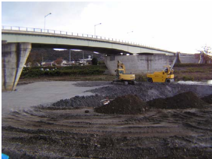
▲泉地区工事用道路その他工事の様子