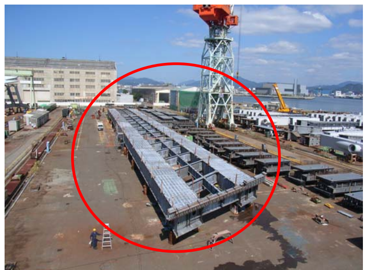
▲清水大橋上部工工事で架ける橋桁