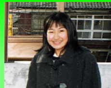
本宮町立本宮第一中学校