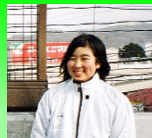
本宮町立本宮第一中学校

先日、橋梁の橋名板の披露式におよび いただいて、ありがとうございます。 この橋の名前を書いたのは、先生に急に国 語の時間、橋の名前を書くようにと言われて 短い時間で書かなくてはいけなかったので、 何枚も納得がいくように書くことが出来なく て、まさか私の作品が選ばれると思いません でした。家族にも、この橋がある限りずっと 残るものだと言われて、自分でもこれはすご いことだということに気がつきました。校長 先生や他の先生達にも大変はめていただきま した。私にはこのような経験があまりなかっ たので、ちょっとはずかしいような気がして います。本宮町の4号の四車線道路も全線が 開通すれば、とてもきれいで素敵な道路にな ると思います。こういう素晴らしい風景の中 の一つに私の文字が残るということを将来私 の子供や孫に伝えていけたらいいなと思っ ています。最後に、私の作品を選んでいただ きありがとうございます。