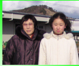
本宮町立本宮小学校