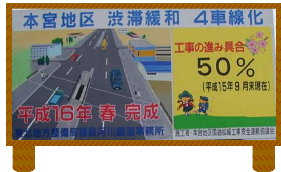
本宮道路改良舗装工事