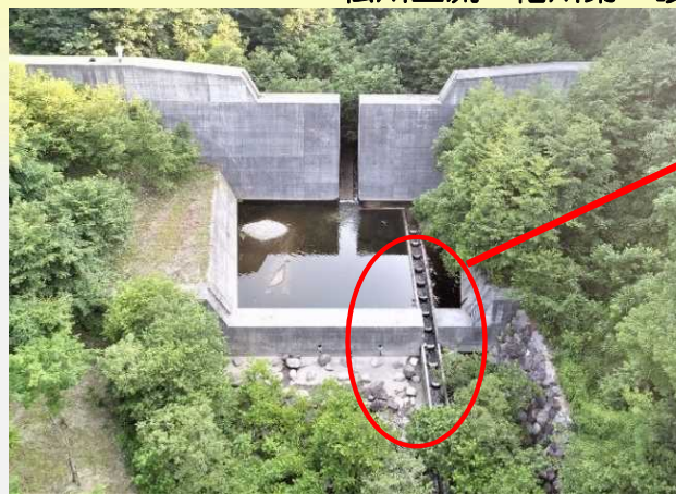
松川上流 そでがわだいいちさぼうえんてい 袖川第一砂防堰堤の魚道

砂防えんていの形や川の地形、すんでいる魚の種類などに合わせ、魚道にもいろいろな形があります。松川の上流にはこんな魚道があります。