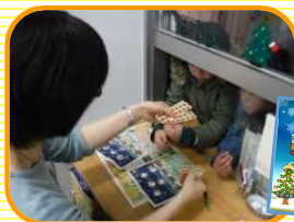
お楽しみスタンプカード