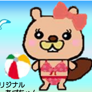
まつさぼオリジナル キャラクターあづちゃん