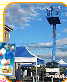
12月バージョン 工事車両乗車体験

① 現在、イベントの開催予定はありませんが、コロナ収束後、みなさんからのアンケート結果をもとに、楽しいイベントを計画していきたいと思っております。まってね♪