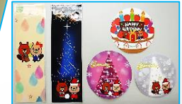
大人気のまつさぼオリジナルグッズ