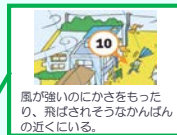
風が強いのにかさをもったり、飛ばされそうなかんぱんの近くにいる。