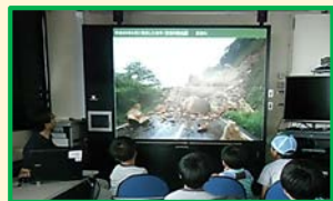
*砂防学習会の様子*

画ぞうをみて土石流について分かったところで、『土石流ミニ模型』を使って、さらに防災や砂防の仕事について学習しよう！