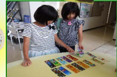
どれにしようかな～♪