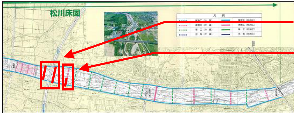
松川流路工第10号帯工他工事

松川砂防出張所における工事現場のうち、昨年11月25日に松川流路工第5床固右岸工事が、12月16日に松川流路工第10号帯工他工事が完成しました。これらの工事が完成したことにより、川底が削られるのを防ぎ安定した川の流れを保つことで、洪水の氾濫を防ぎます。