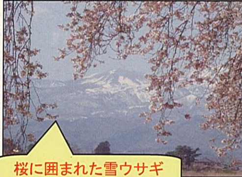
桜に囲まれた雪ウサギ