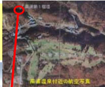
高湯温泉付近の航空写真