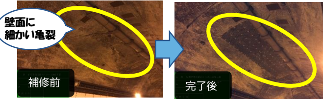
カバーを取り付け漏水対策