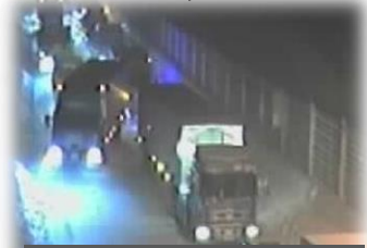
立ち往生車で渋滞が発生

国道13号栗子峠では大雪の際、急な上り坂で大型車がスタック(立ち往生)することにより交通障害が発生しています。その場合、 スタック処理と集中除雪のために通行止め を行うことがあります。