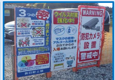
町下地区道路改良工事