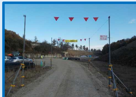
浅川地区道路改良工事