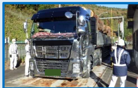
★特殊車両取り締まり★