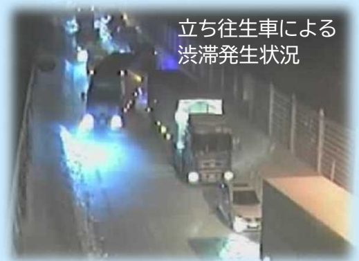
立ち往生車による渋滞発生状況