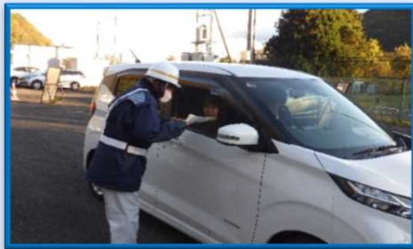
★冬タイヤキャンペーン★