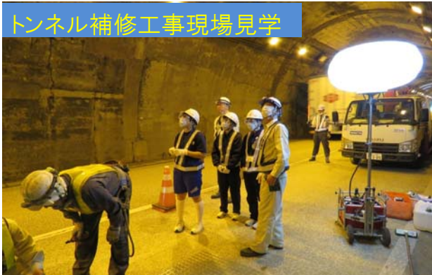
トンネル補修工事現場見学