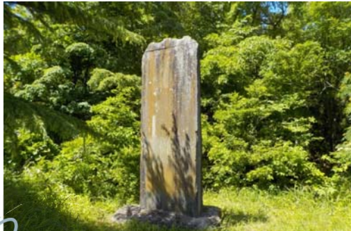
栗子国道維持出張所 敷地

栗子隧道碑記は、明治15年に栗子隧道米沢側坑口に建立されたもので、当時の新道開削の偉業について記されています。現在の国道13号栗子ハイウェイ開通後は栗子国道維持出張所に移設されておりましたが、より多くの皆さんにご覧頂くことを願い「道の駅米沢」建物東側敷地内に移設されました。