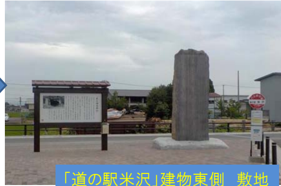
「道の駅米沢」建物東側 敷地