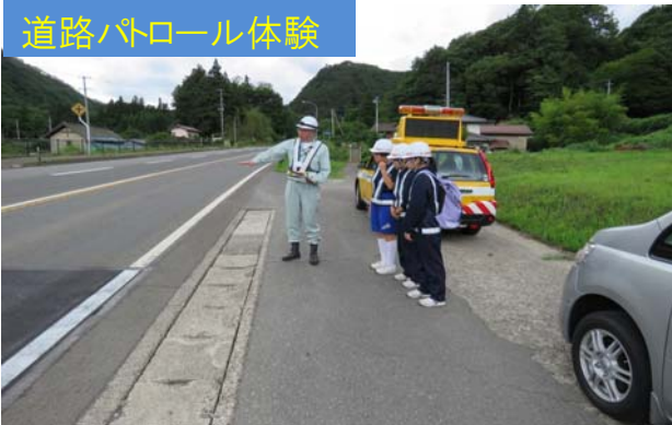
道路パトロール体験

7月3日～5日にかけて福島河川国道事務所において中学生のドリームアップ事業(職場体験)が実施されました。今回は福島市内の中学生3名に参加頂き、道路・河川・砂防施設の見学や各管理業務の体験をして頂きました。カリキュラムの最終日、当栗子国道維持出張所では、道路パトロールの体験、建設機械の見学、トンネル補修工事の現場見学をして頂きました。