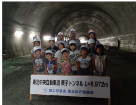
米沢市立窪田小学校のみなさん （栗子トンネル内にて）