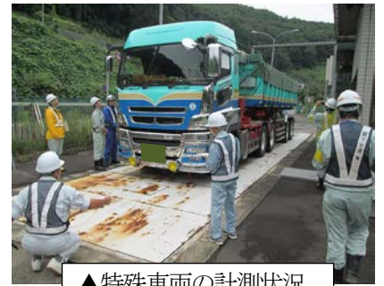
▲特殊車両の計測状況

道路法では一定の大きさや重さを超える車（特殊車両）を通行させることは、 道路構造の保全や交通の危険防止 の観点から原則として禁止しています。しかし、道路管理者がやむを得ないと認めた場合に限り、大きさ・重さ・経路・時間帯などの条件を付けたうえで通行許可証を発行し、その通行を認めています。