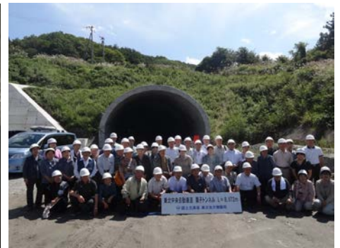
川西町小松地区のみなさん （栗子トンネル米沢側坑口にて）