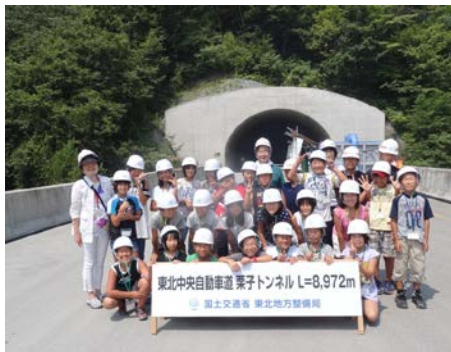
米沢市立南原小学校のみなさん （栗子トンネル福島側坑口にて）

東北中央自動車道（福島～米沢北）は、平成29年度の（無料）開通めざして現在工事を進めています。今年の夏も米沢市立窪田小学校、南原小学校の子供たちや米沢市内の皆さんがたくさん見学に訪れました。栗子トンネル（道路トンネルとして東北一の長さ／8,972m）を歩いて見学したり、橋梁の大きさ、高さを生で体験したりと、開通後にはできない貴重な体験をしていただいています。