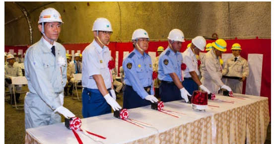
貫通発破のスイッチを押す関係者