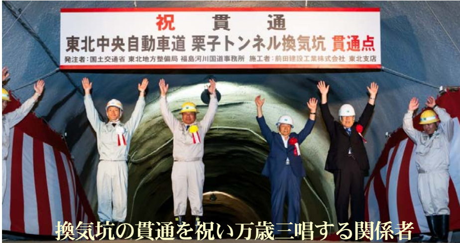
換気坑の貫通を祝い万歳三唱する関係者

東北中央自動車道（大笹生 IC（仮）～米沢北 IC 間）の約 3.7km は、平成 29 年度の（無料）開通をめざして現在工事を進めています。道路トンネルとしては東北最長となる「栗子トンネル（延長 8,972m）」は、昨年 3 月 22 日に貫通しています。その栗子トンネルの換気用トンネル（延長 2,609m）については、平成 26 年 1 月より掘削を進めていましたが、7 月 22 日に無事貫通しました。