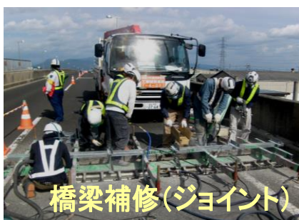
橋梁補修(ジョイント)