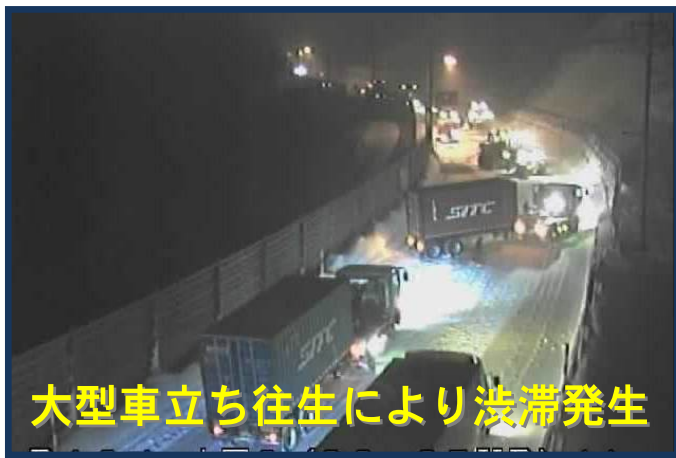
大型車立ち往生により渋滞発生

昨年冬の国道13号栗子峠では、スリップにより立ち往生した車が 114台 (うち 大型車99台 )発生しています。スリップによる立ち往生は、交通事故や渋滞による交通障害を引き起こし大変危険です。 冬タイヤへの交換 を確実にし、 安全運転 を心がけましょう。