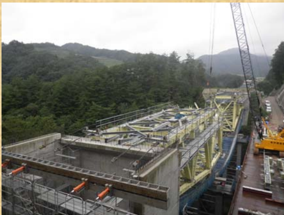
新長老沢第1橋の架設状況

現在、「万世大路」第四世代となる東北中央自動車道（福島～米沢北）は、平成29年度の供用をめざし、トンネルや橋梁などの工事が進められています。現場見学者は7,800名（8月末現在）を超えています。