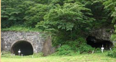
栗子隧道西坑口（初代と二代目）