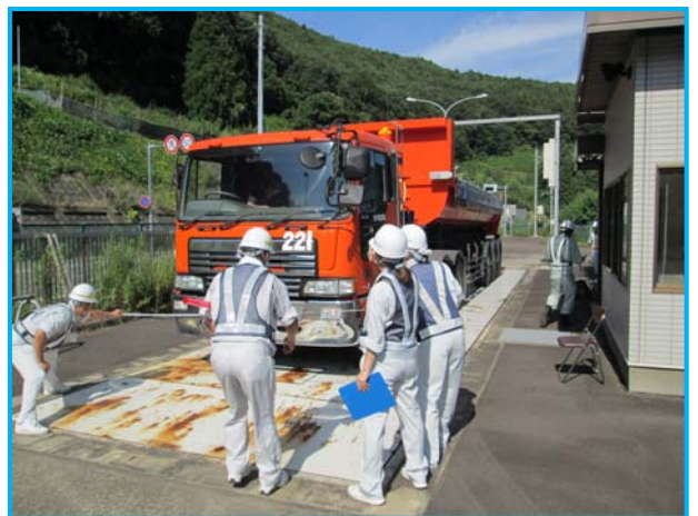
▲特殊車両の計測状況

約2時間で3台の特殊車両を取締り、そのうち1台が決められた重さを超えていたことから、積載物を軽減するよう指導しました。