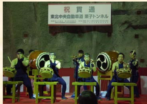
▲飯坂八幡神社・祭り太鼓