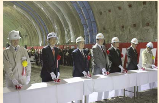
▲福島県側の貫通発破

当日は、「貫通発破」などの貫通式を行い、その後復興大臣はじめ、福島と山形の両県から知事、市長、地元選出国會議員など来賓の皆様をお招きし、総勢約380名が出席した貫通祝賀式を行いました。