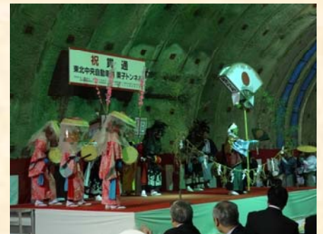
▲万世町梓山獅子踊