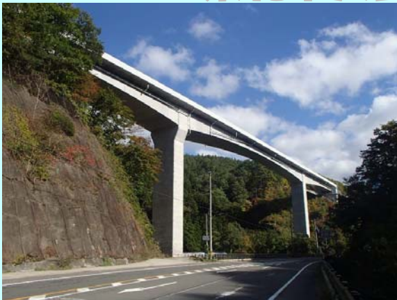
▲長老沢3号橋(仮称)が完成しました