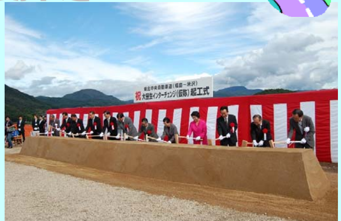
▲大笹生IC(仮称)の起工式が行われました。

栗子トンネルは11月28日(木)現在、福島県側から5,146m、山形県側から3,673m(全体8,819m)まで掘り進んでおり、 残り153m となっています。今年度中の貫通を目標に工事を進めており、完成すると 東北の道路トンネルでは1番 、全国でも5番目の長さとなります。東北中央自動車道 福島～米沢間はH29年度開通予定です。