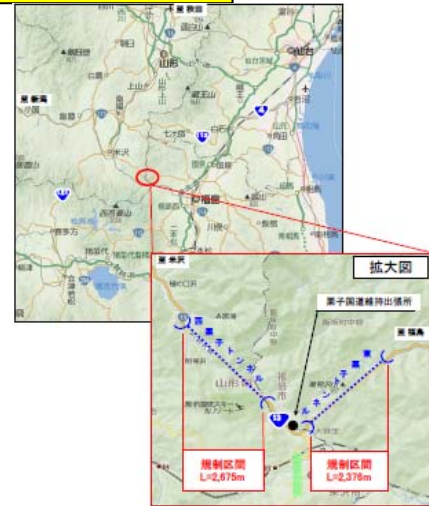
▲トンネル天井版撤去工事の実施区間

詳しくは、福島河川国道事務所のホームページでご確認ください。URLは以下のとおりです。 「 http://www.1a.thr.mlit.go.jp/Bumon/J77101/homepage/index.htm 」