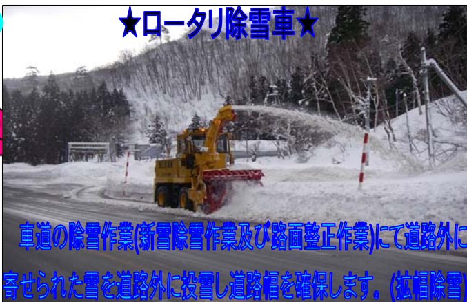
車道の除雪作業(新雪除雪作業及び路面整正作業)にて道路外に寄せられた雪を道路外に投雪し道路幅を確保します。(拡幅除雪)