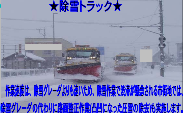
作業速度は、除雪グレーダよりも速いため、除雪作業で渋滞が懸念される市街地では、除雪グレーダの代わりに路面整正作業(凸凹になった圧雪の除去)も実施します。