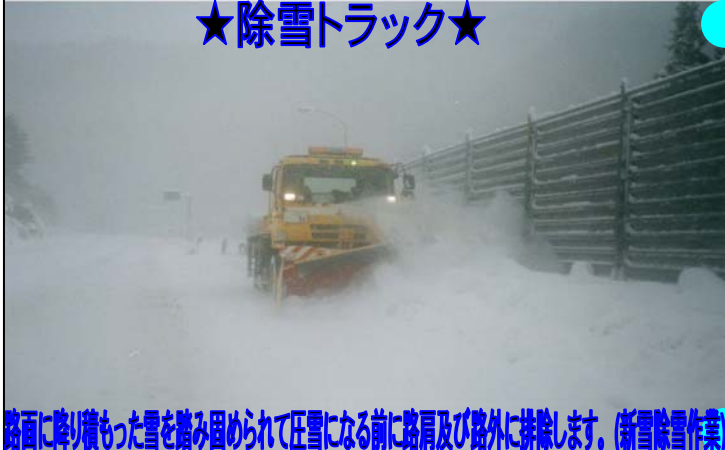
路面に降り積もった雪を踏み固められて圧雪になる前に路肩及び路外に排除します。(新雪除雪作業)