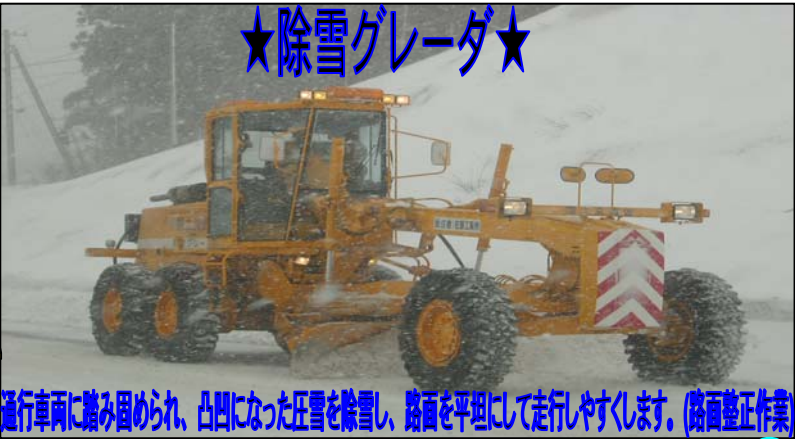
通行車両に踏み固められ、凸凹になった圧雪を除雪し、路面を平坦にして走行しやすくします。(路面整正作業)