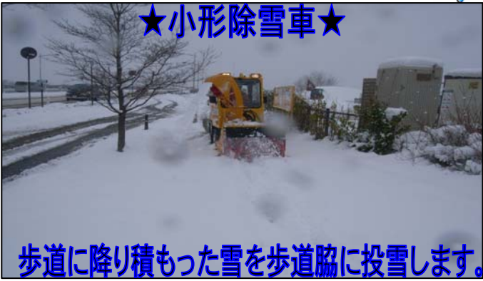
歩道に降り積もった雪を歩道脇に投雪します。