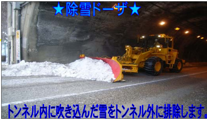
トンネル内に吹き込んだ雪をトンネル外に排除します。