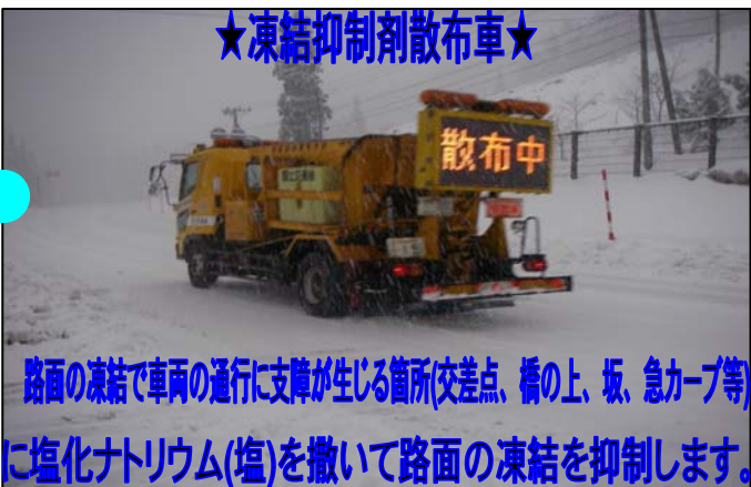
路面の凍結で車両の通行に支障が生じる箇所(交差点、橋の上、坂、急カーブ等)に塩化ナトリウム(塩)を撒いて路面の凍結を抑制します。