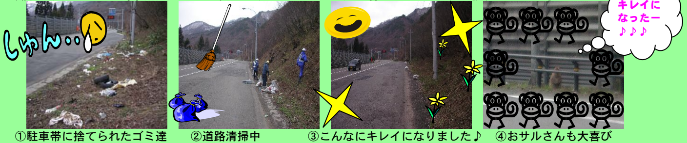
①駐車帯に捨てられたゴミ達 ②道路清掃中 ③こんなにキレイになりました♪ ④おサルさんも大喜び

道路にポイ捨てされたゴミの収集はこれまでの外部委託にかわって、職員 2 名で毎週実施しています。落ちていたものは様々で空き缶・ペットボトル、市販の弁当の空容器などです。みなさん、道路はキレイに使いましょう～！