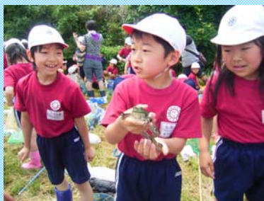
大きいカエルつかまえた!