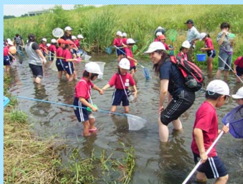
つめたくてきもちいい～♪