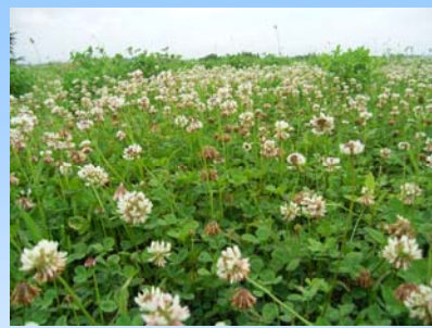
シロツメクサ (郡山市)