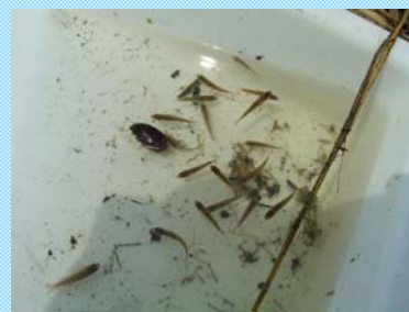
・・・たくさんいました。