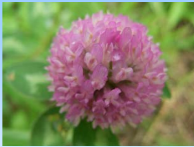
アカツメクサ (郡山市)