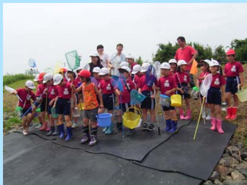
はやく見つけにいきたいなあ～