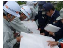
郡山市富久山第1分団