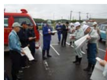
本宮地区隊第6分団