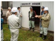
二本松市水防倉庫