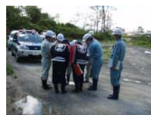
郡山市田村第3分団