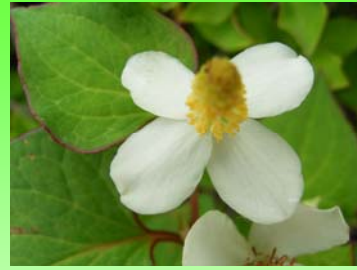
葎草 ドクダミ (郡山市富久山町)