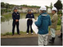
郡山市富久山第4分団