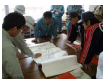
郡山市中央第3分団 郡山市安積第1・2分団