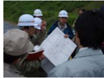
二本松地区隊第3・6分団