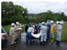
郡山市日和田第3分団