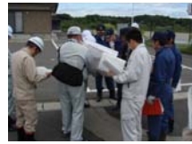
須賀川市第2・3・4分団