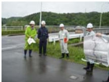
郡山市富久山第2分団