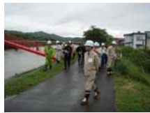
本宮地区隊第1・2・7分団