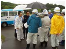
郡山市西田第2分団