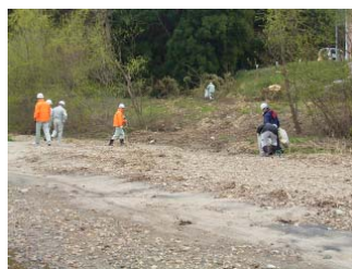
釈迦堂川新橋 (須賀川市)

点検には、郡山出張所と福島河川 国道事務所のほか、須賀川市・郡山 市・玉川村・永盛小学校・アメンボウク ラブの方々にご参加頂きました。