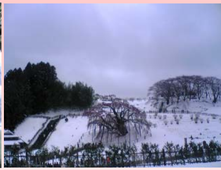
雪をかぶった滝桜(三春町)