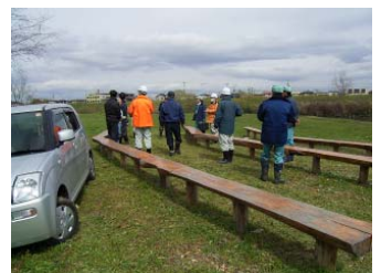
日出山水辺の小楽校(郡山市)