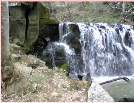
八流の滝 (須賀川市)