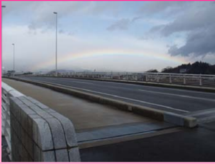
虹の架け橋 (本宮市安達橋)