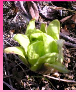
春の芽吹き～ふきのとう (郡山市西田町鬼生田)