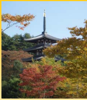
安達ヶ原 五重塔 (二本松市)