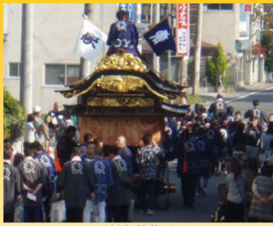
本宮秋祭り (本宮市安達橋付近)