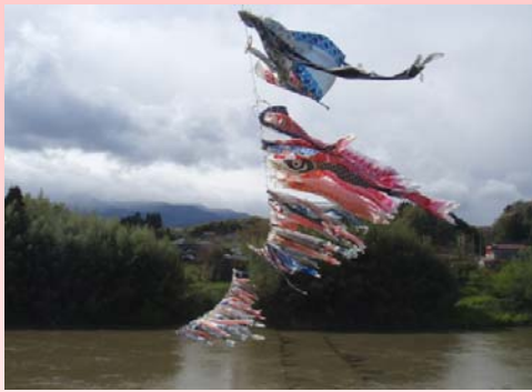
鯉のぼり (二本松市高田橋)