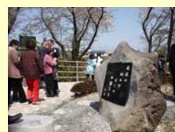
《芭蕉来道320周年記念句碑》