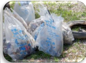
▲新橋水辺の小楽校