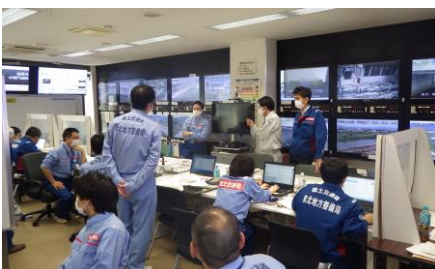
◀▼福島河川国道事務所

本格的な出水期を前に万全を期するため、令和元年東日本台風の教訓を活かし、大雨による河川の氾濫を想定した洪水対応演習が実施されました。演習では関係機関との情報伝達や各種防災システム訓練、被災箇所への調査・情報把握の演習も行われました。