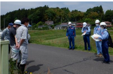
上竹用水樋管付近▲▶

許可工作物（河川管理者の許可を得て設置している樋門・樋管や橋梁など）20箇所をまわり、実際にゲートを開閉させたり、内部の状況を確認するなど、施設管理者と合同で点検を行いました。点検の結果、大きな異常は有りませんでした。