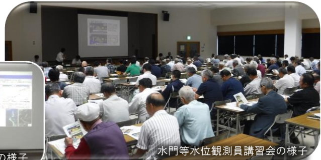
水門等水位観測員講習会の様子