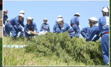
郡山市消防団：木流し工