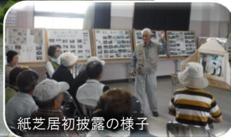
紙芝居初披露の様子