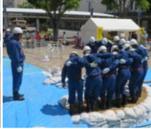
サテライト会場：郡山駅 郡山市消防団：月の輪工