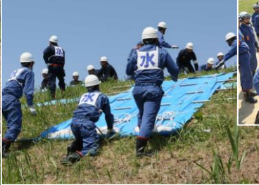
玉川村消防団：シート張工