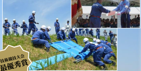
二本松市消防団：シート張工