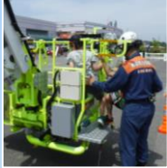
サテライト会場 日和田フェスタ 災害対策車両・機械展示