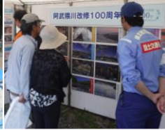
演習会場：阿武隈川 パネル展示