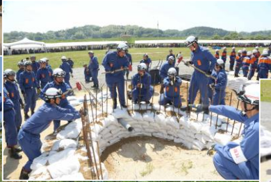
本宮市消防団：月の輪工