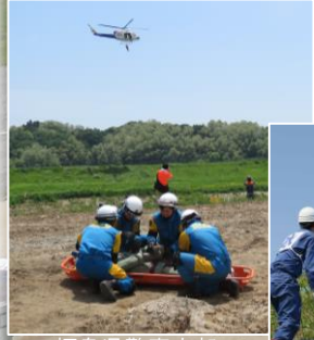
福島県警察本部 救助・救出訓練