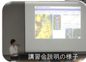
講習会説明の様子

郡山出張所管内の水門等水位観測員の皆さまにお集まりいただき、講習会を郡山市労働福祉会館で行いました。講習会では規律や樋門の点検・操作、出水時に使用する報告システムの操作確認などの説明が行われました。