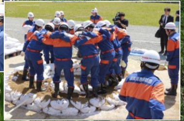
須賀川消防団：釜段工