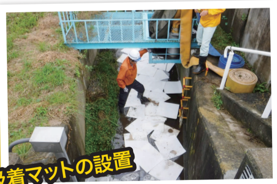
オイル吸着マットの設置

6月に須賀川市で農業用施設から油が流出する事故がありました。油流出事故が起きると、流出した油を処理するためにオイルフェンスやオイル吸着マットを設置することとなり、それらの費用は原因者の負担となります。その場合、原因者負担は数十万から百万円以上と高額になることもありますので、油の取扱いにご注意ください。