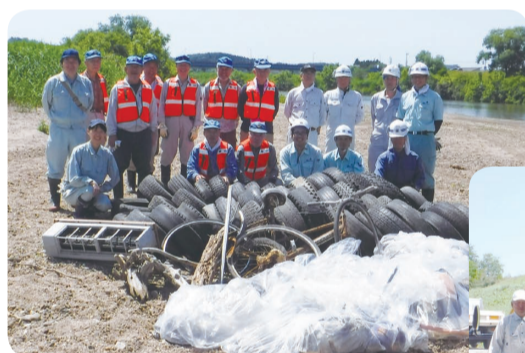
郡山市富久山町 北小泉地区

今年は天気に恵まれ、阿武隈川漁業協同組合郡山支部、阿武隈川砂利採取組合の方々と河川清掃を行いました。この清掃で90Lのごみ袋約10袋分の家庭ごみ、自転車2台、タイヤ約230本、エアコンや換気扇など、多くのごみを回収しました。