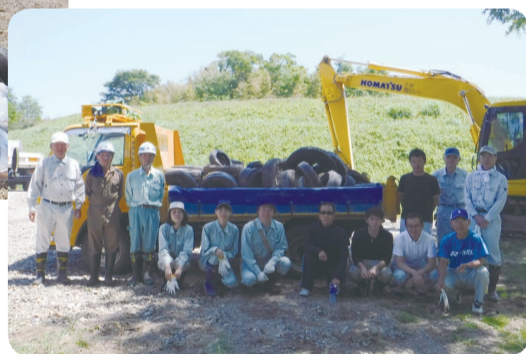
郡山市西田町 鬼生田地区