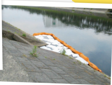
オイルフェンスの設置