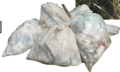
◀ 河川敷に投棄・流れ着いたゴミの回収も行いました