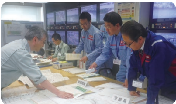
▲ 福島市にある福島河川国道事務所での訓練の様子

大規模な出水を想定した洪水対応演習を、福島県や管内の市町村など合わせて約 150 人で行いました。演習では河川巡視点検・報告システム操作訓練や、郡山市内で堤防が決壊した想定で、被災箇所の調査、状況把握および緊急復旧工法検討などが行われました。