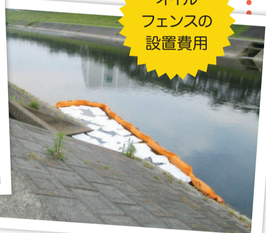
オイルフェンスの設置費用