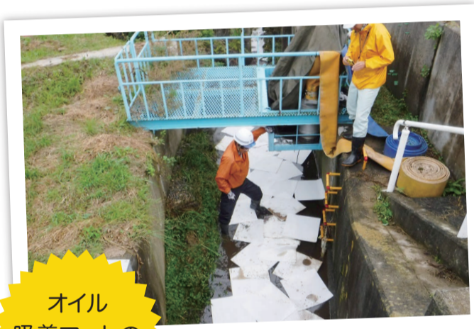
オイル吸着マットの設置費用