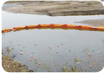
◀ オイルフェンスを設置することで、河川に流出した油類の拡散を防ぐことができます