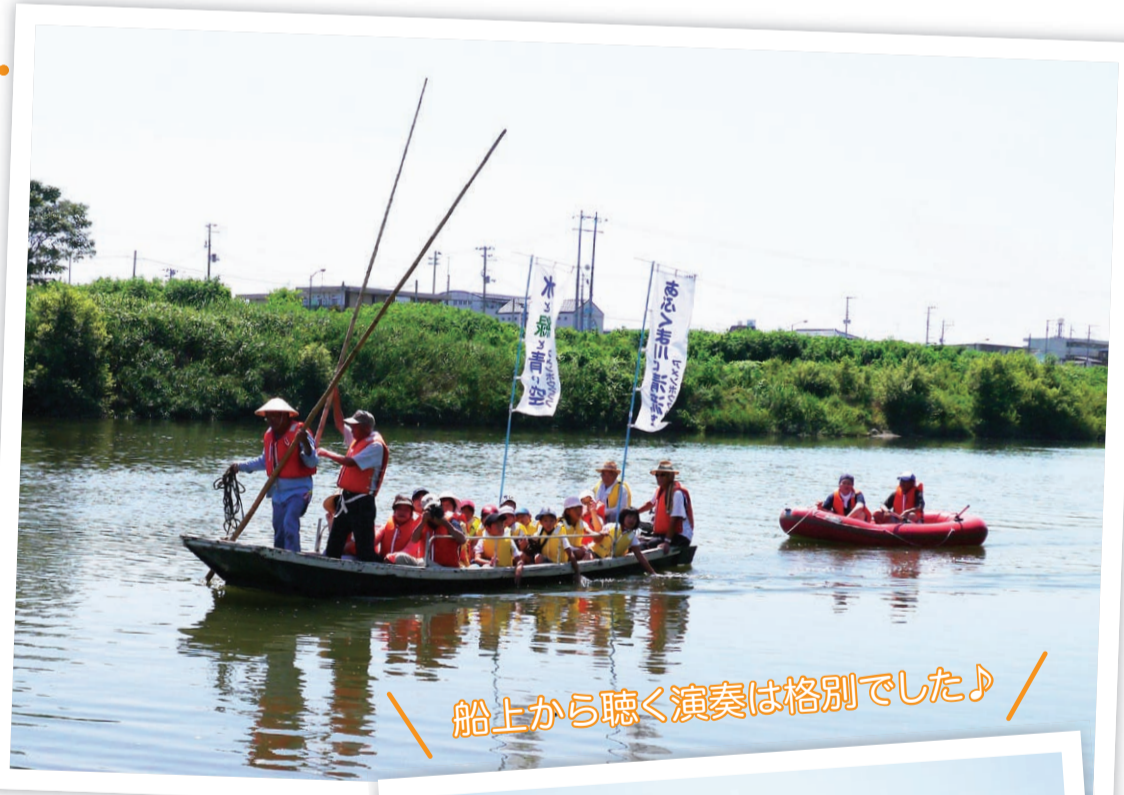
船上から聴く演奏は格別でした♪