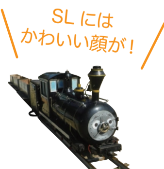
SLにはかわいい顔が!