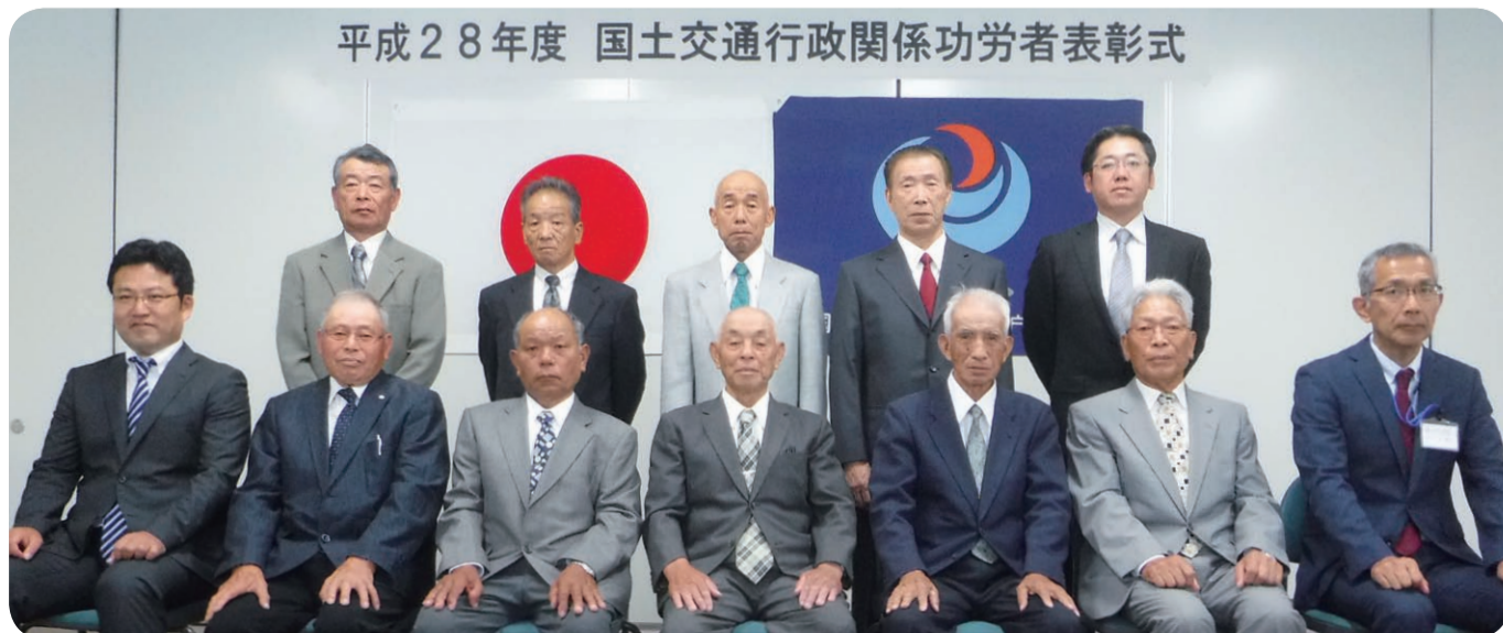
平成28年度 国土交通行政関係功労者表彰式