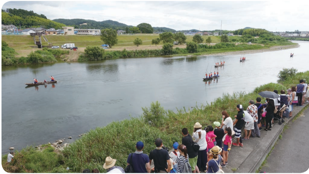
本宮夏祭りで行われた舟こぎ競争(上)と花火(左)