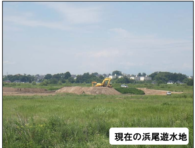
現在の浜尾遊水地