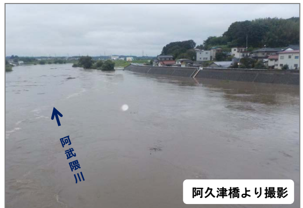
阿久津橋より撮影

台風11号及び前線に伴う大雨により、郡山出張所管内では今年初めての出水対応を行いました。須賀川・阿久津・二本松の各観測所において、はん濫注意水位を超える出水でした。樋門・樋管操作、河川巡視や内水排除作業は翌17日未明までの長時間の対応となりましたが、出水による被害は生じませんでした。大変ご苦労様でした。