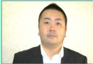
長根管理第二係長