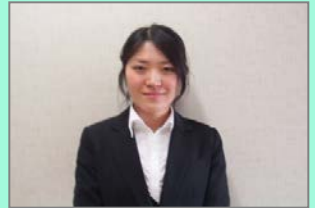
小野瀬期間業務職員