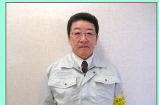
中村工事監督支援業務員