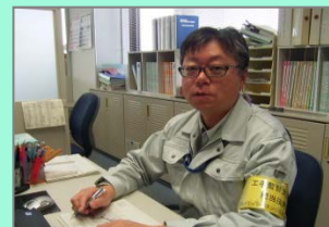
船山工事監督支援業務員