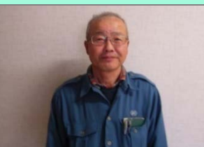
佐久間河川巡視員