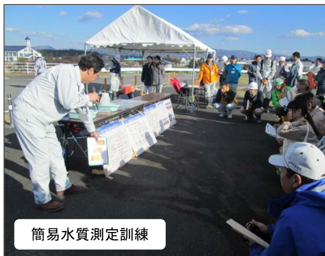
簡易水質測定訓練

オイルフェンス設置訓練に加え、簡易水質測定訓練や魚類へい死時水質測定講習、側溝の油流出防止策実技訓練など、各水質事故担当者が受講しました。