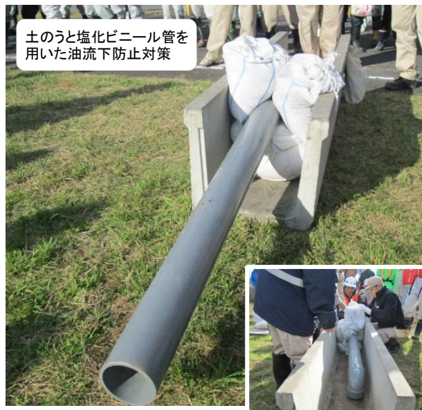
土のうと塩化ビニール管を用いた油流下防止対策