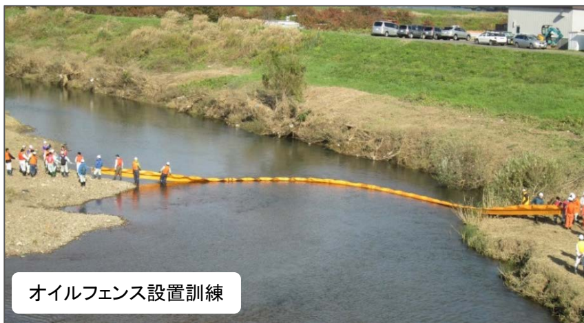
オイルフェンス設置訓練

暖房機器の使用が増えるこの時期、灯油など油類が河川や水路に流出した場合、迅速な対応で被害拡大防止に努める事を目的とした「平成26年度水質事故対策及び水質異常時対応講習会」を開催しました。