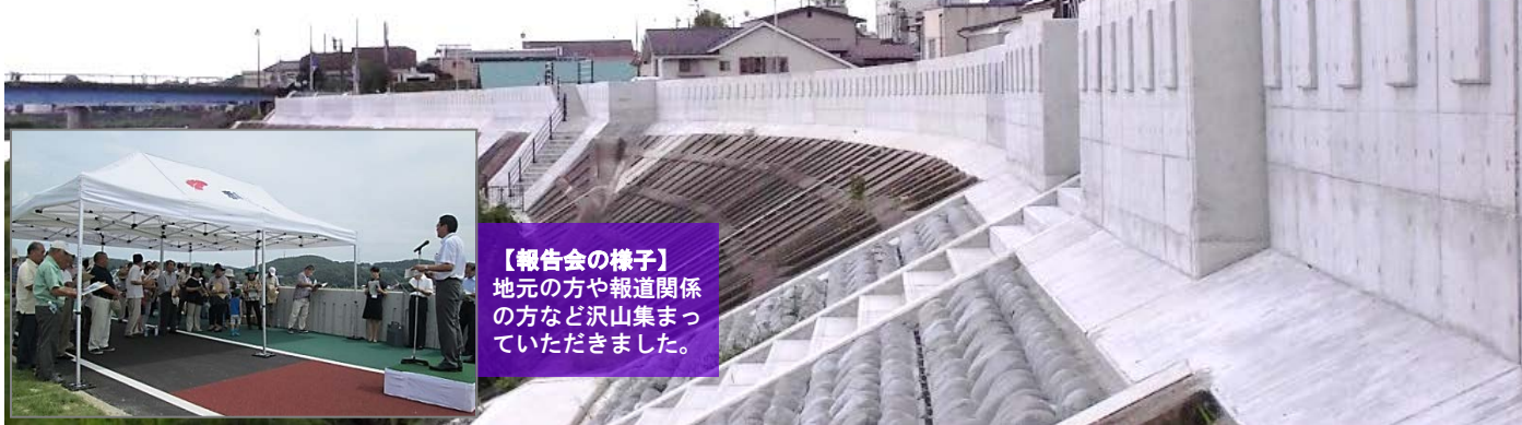
【報告会の様子】 地元の方や報道関係の方など沢山集まっていたきました。

新しい堤防は堤防高が1.5m高くなり、必要な堤防断面も確保されました。背後の住宅の影響も考えパラペットによる特殊堤の整備となり、外観も美しく利用しやすい河川環境が整いました。