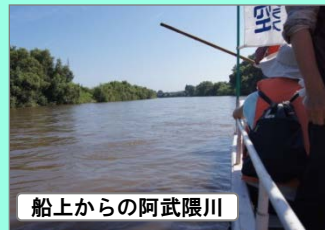
船上からの阿武隈川

8月2日、日出山アメンボウクラブさんによる阿武隈川での舟下りが今年も行われました。普段見る事のない、川面からの景色に子ども達の目がキラキラ輝いていました。ボンネットバスやミニSL乗車などもあり、楽しい夏休みの一時となりました。