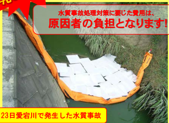
7月23日愛宕川で発生した水質事故