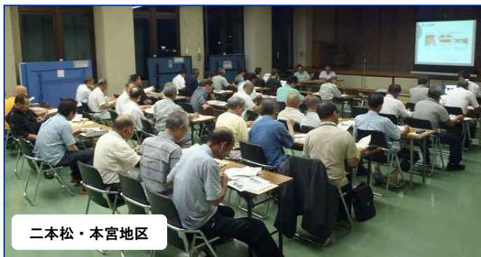
二本松・本宮地区

二本松・本宮地区、郡山地区・須賀川地区の水閘門操作員講習会が開かれました。河川管理の取組では、郡山出張所管内・7ヶ所に設置（予定含む）されている、河川情報表示板の運用内容の説明や堤防除草の現状などの説明が行われました。また、携帯電話を使用しての樋門・樋管情報管理システムの操作確認が行われ、スムーズな情報管理が行われるよう実践方式で操作の確認が行われました。お忙しい中、ご参加いただきありがとうございました。