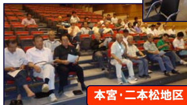
本宮・二本松地区