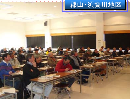
郡山・須賀川地区

操作員のみなさんは熱心に受講され、施設点検や操作技術の知識と技能向上を図っていただきました。