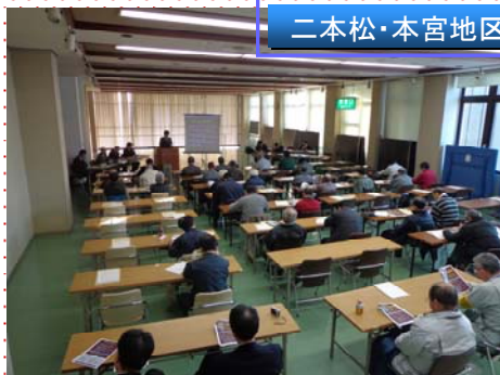
二本松・本宮地区