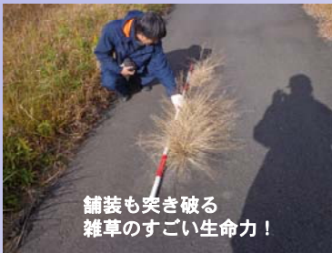
舗装も突き破る 雑草のすごい生命力！