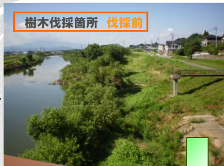
樹木伐採箇所 伐採前