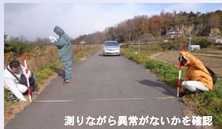
測りながら異常がないかを確認

今年5月にも出水期を前に職員らが徒歩で巡視を行いましたが、今回の点検は、その後、約半年間の時間経過の中で新たな異常や変状の有無を確認したものです。