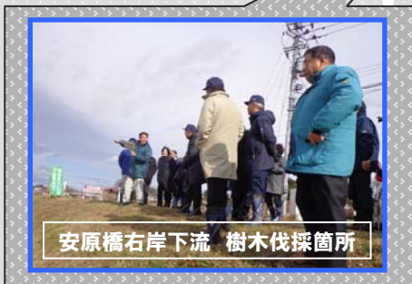
安原橋右岸下流 樹木伐採箇所