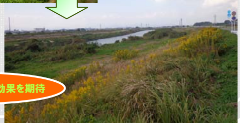
樹木伐採箇所 伐採後