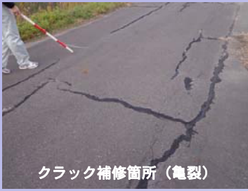
クラック補修箇所（亀裂）